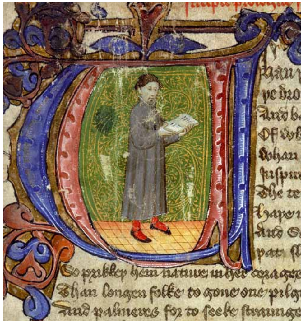
Geoffrey Chaucer, The Canterbury Tales , initiaal in het Lansdowne-manuscript, 1413–22. British Library