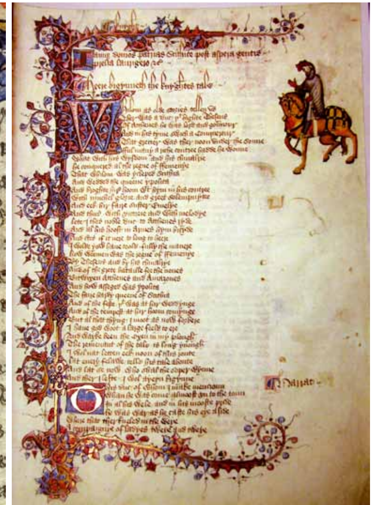
Geoffrey Chaucer, The Canterbury Tales , bladzijde uit het Ellesmere-manuscript, 14de eeuw. University of Arizona Library