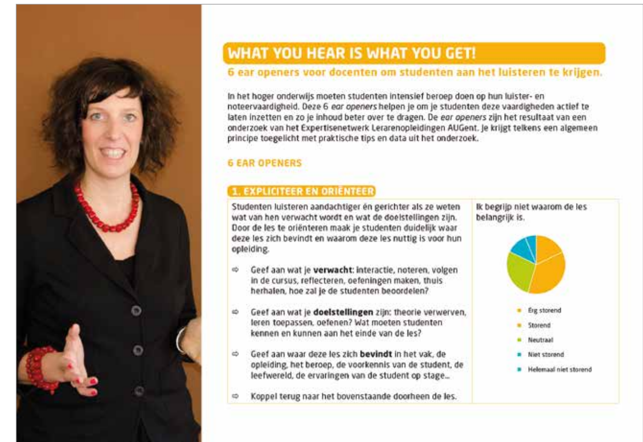
Kader 2. Fragment uit de steekkaart voor docenten

Studenten die problemen hebben met noteren, nemen niet altijd de tijd om een uitgebreide leidraad door te nemen. Veel andere remediëringsinitiatieven bereiken ook amper de groep die ze het meeste nodig heeft. Er werd daarom gekozen voor acht hapklare noteertips. Op de voorzijde wordt elke tip geïllustreerd met een goed voorbeeld van notities. De voorzijde, goed voorbeeld en acht tips is in één oogopslag op te nemen. Als de student zich verder wil inwerken, kan hij op de achterzijde terecht. Daar wordt het nut van elke tip verklaard en vinden studenten ook een legenda