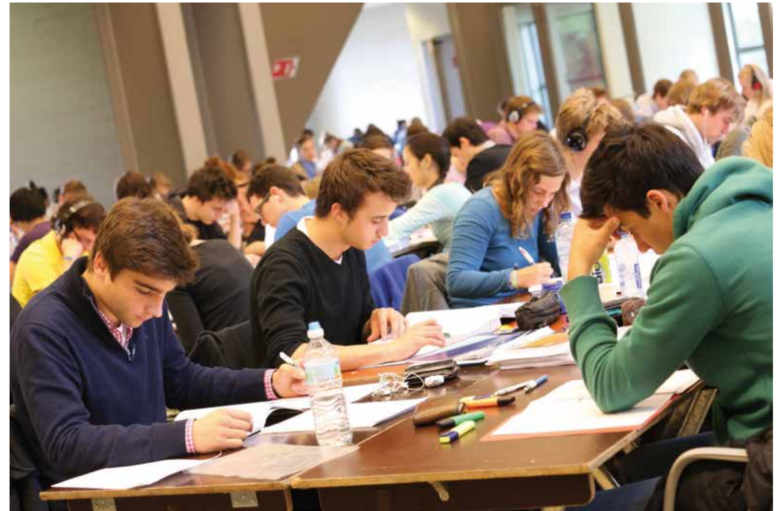
Studenten van de Universiteit Gent.

Deze leemte betekent niet dat luisteren of noteren geen probleem vormt. In onderzoek van De Beir (2009) naar talige knelpunten bij studenten en lerarenopleiders duidt luistervaardigheid zowel bij docenten als studenten op in de top vijf van taalproblemen. Daarnaast signaleren De Wachter en Heeren (2011) in hun behoefteanalyse 'het ontbreken van de noteer-reflex' bij veel