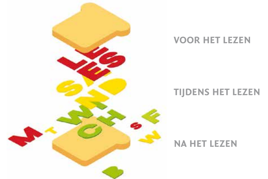
Figuur 3. De leessandwich

Dat vraagt activiteiten van de docent voor het lezen, want veel leerlingen hebben geen idee wat ze gaan lezen. De opdracht 'Lees de tekst en maak de vragen' is dodelijk voor de motivatie en de leesvaardigheid. Leerlingen gaan daardoor plichtmatig met een tekst aan de slag en zijn alleen gericht op het goed beantwoorden van vragen. Ze zoeken in de tekst naar het goede antwoord zonder dat ze de tekst écht lezen, laat staan begrijpen. En ze slaan de lastige (lees: open) vragen vaak over, omdat dat veel moeite kost. Daardoor oefenen ze dit type vragen minder, waardoor ze op de toets verrast worden door de complexiteit van dit soort vragen.