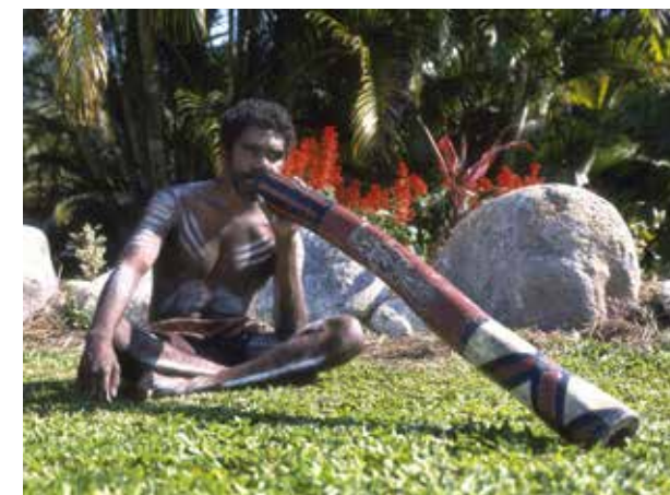
(opgenomen in Stepping Stones )

een leestekst over de traditionele levensstijl van sommige Aboriginals. De opdrachten in het tekst- en activiteitenboek maken verder geen gebruik van het beeld, terwijl het inhoudelijk, beeldtechnisch en didactisch veel te bieden heeft.