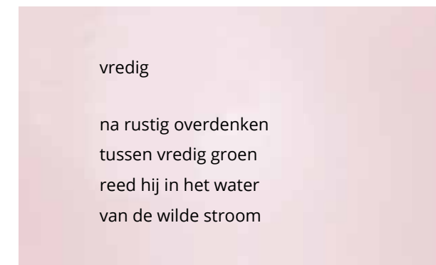
Afbeelding 5. Het gedicht 'Vredig', dat een deelnemer aan onze workshop maakte op 20 november 2018 tijdens de Dag van het Literatuuronderwijs in Rotterdam. Zie @poem.artist op Instagram. Gereproduceerd met toestemming van de auteur

Ter verwerking kozen de deelnemers één woord uit de wolk dat zij verrassend vonden en wisselden hun argumenten daarvoor uit met hun buur. Daarna zetten