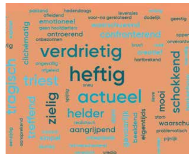
Afbeelding 4. De woordwolk die de deelnemers aan onze workshop maakten op 20 november 2018 op de Dag van het Literatuuronderwijs in Rotterdam