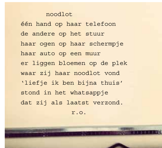
Afbeelding 3. Een gedicht van René Oskam. Zie @reneoskam op Instagram. Gereproduceerd met toestemming van de auteur