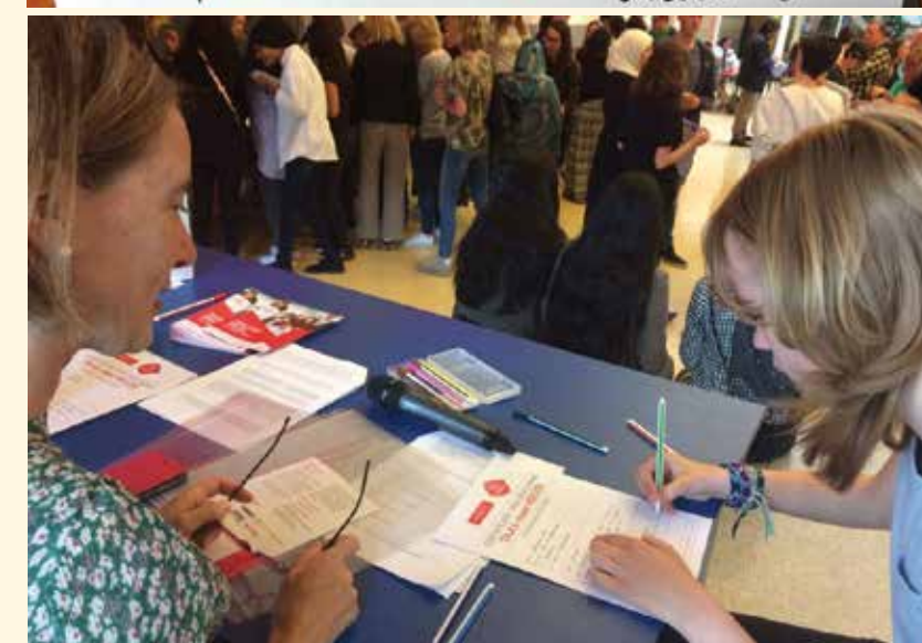
Taal naar Keuze op de Espritscholen in Amsterdam.