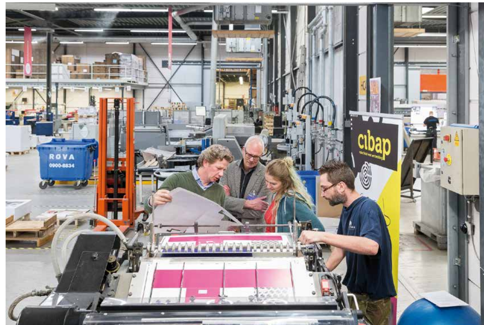
Studenten van Cibap doen vakkennis op bij drukkerij Zalsman.

het curriculum. Dit om de 'leesmotor' van de studenten (weer) op gang te brengen of te houden, onder andere vanwege de positieve effecten van regelmatig lezen op de leesvaardigheid. De afgelopen schooljaren lazen studenten uit het eerste jaar zodoende in twee lesperiodes tijdens hun wekelijkse les Nederlands een kwartier in een zelfgekozen boek. En hoewel dit veelal werd gewaardeerd wegens de rust die het bracht, ontwikkelden diverse studenten door het vrijleesmoment alleen maar meer 'leestegenzin': zij vonden het stom, vervelend en nutteloos. Een reden om het vrij lezen op de school onder de loep te nemen. Zou een aanpassing van het vrijleesprogramma het leesplezier kunnen vergroten? In één klas is hiermee geëxperimenteerd en het lijkt erop dat de aanpassing heeft geleid tot een