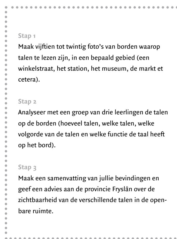
Kader 2. Opdracht 'Linguistic landscapes'

Om te bepalen welke benadering op welk moment