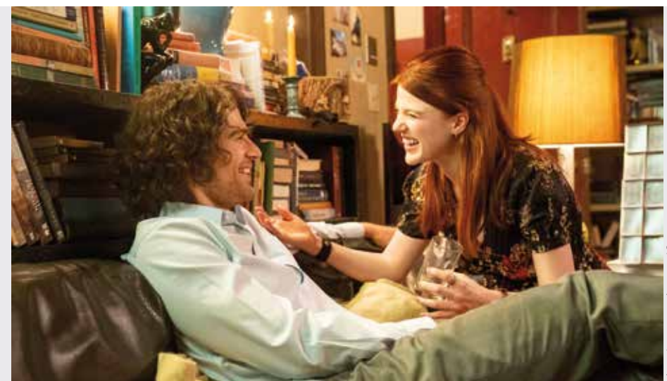
The Time Traveler's Wife

The Time Traveler's Wife is te zien op verschillende streamingdiensten en verkrijgbaar op dvd