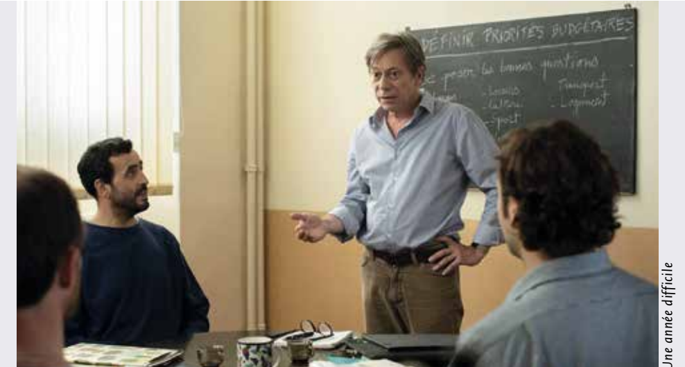
Une année difficile

De film Oppenheimer is gebaseerd op het boek American Prometheus van Kai Bird en Martin J. Shirwin. J. Robert Oppenheimer is een briljante wetenschapper die gevraagd wordt om in allerijl een centrum op te zetten voor de ontwikkeling van de atoombom. Hij krijgt onbeperkte middelen en laat midden in de woestijn een dorp neerzetten waar aan het Manhattan Project wordt gewerkt. Oppenheimer stort zich op de uitdaging en slaagt er uiteindelijk in om een atoombom te maken. Maar wanneer hij de gevolgen ziet van de bombardementen op Hiroshima en Nagasaki, veranderen zijn gevoelens. Hij beseft de morele verantwoordelijkheid die nu op zijn schouders rust en probeert het gebruik van de bom te reguleren. De film houdt niet op met het succesvolle gebruik van de bom, maar gaat ook in op de periode na de Tweede Wereldoorlog, waarin de voormalige held plotseling verdacht wordt van deelname aan communistische activiteiten en zichzelf moet verantwoorden. In deze zeer intense film is Oppenheimer de moderne Prometheus: held, maar ook gedoemd tot eeuwig lijden. Schitterende film, geschikt voor een vakoverstijgend project met geschiedenis.