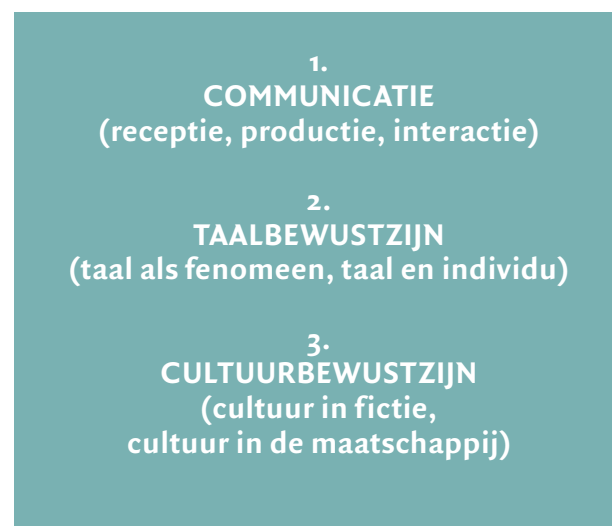
Kader 1. De door de vakvernieuwingscommissie voorgestelde drie domeinen

Laat in je lessen zien hoe digitale middelen het communiceren zelf en het taalleerproces kunnen ondersteunen (Van de Guchte et al., 2022). Leerlingen kunnen bijvoorbeeld een videogesprek opnemen waarbij ze een sollici-