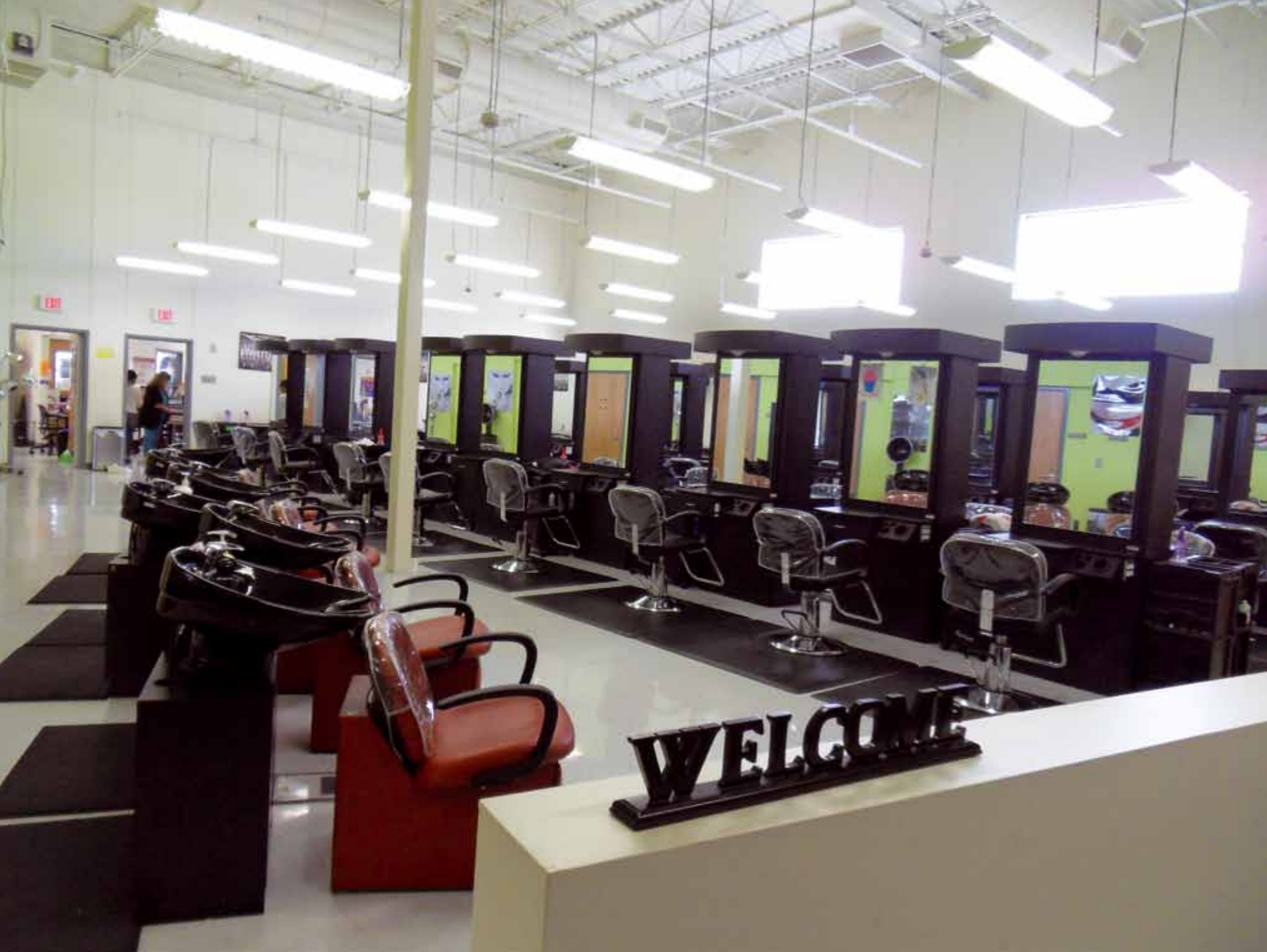
Het vaklokaal voor de opleiding tot schoonheidsspecialiste of kapper in het Birdville Center of Technology & Advanced Learning